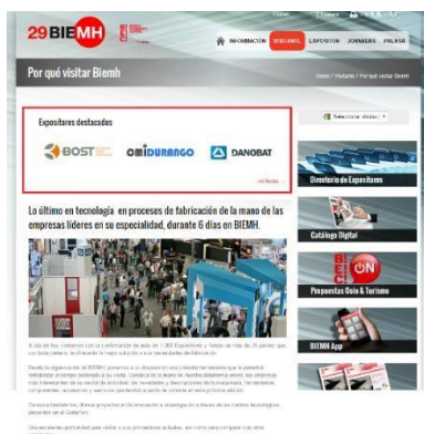
Logos en sección visitantes: por qué visitar