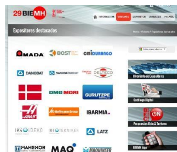
Logos en listado expositores destacados